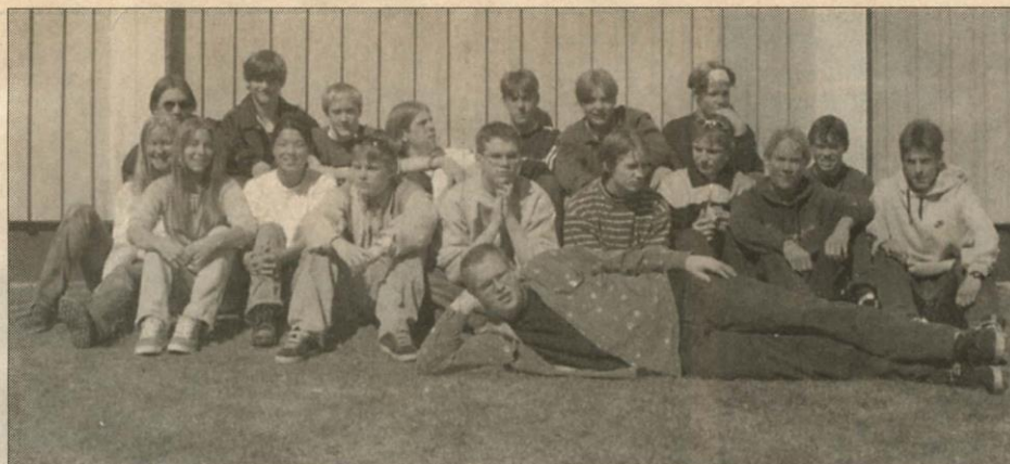
Friskvårdselever årskurs 9 vid Artediskolan, Nordmaling.