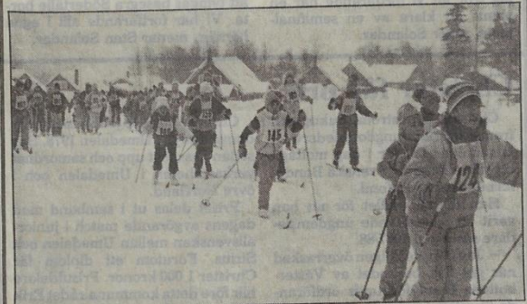
• Det var full fart i den första upplagan av Barnens Vasalopp i Gräsmyr.

Arrangemanget var ordnat av GIK (Gräsmyr IK), som tillsammans med lärarna var med om att genomföra dagen.