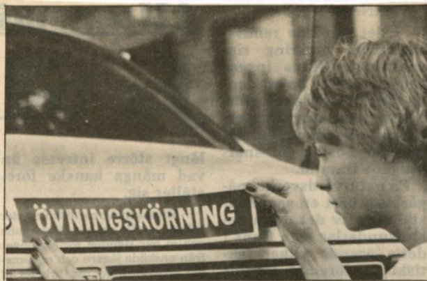
• Åtta orter i länet kommer att förlora möjligheten till körkortsprov om trafiksäkerhetsverkets förslag går igenom.